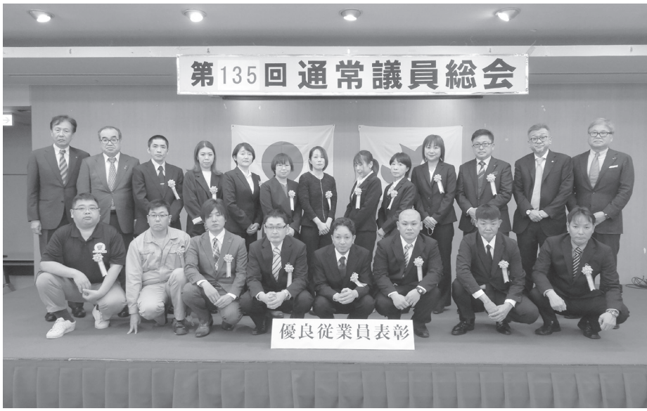
第135回通常議員総会

出荷するときにニラを包む筒状のプラスチックフィルムを工夫して鮮度を保つ技術でした。収穫したニラをこのフィルムに入れて封をする際に、ニラから出る炭酸ガスの量を制御できるようにシール法を開発しました。これによって、鮮度を保てる期間が延びたため、京阪神はもとより、首都圏まで高知のニラは届けられています。また最近ではこのフィルム自体をさらに薄くして使い勝手を高め、技術を進化させています。 流通業界を圧迫する2024年問題もあつて、おいしいものをおいしい状態を保つため、どうやって消費者の元へ届けるかは、大きな課題でもあり、さまざまな素材やシーンで新しい提案が求められている分野です。また、通信販売や出前配送(デリバリー)などでは、消費者の食卓まで、出上がったものをつくり手が届けることも求められています。 消費者はより高度なものをお求め、ますますわがままになります。モノやサービスを届ける事業者にはとても厳しい状況ですが、逆にいえばそこにビジネスチャンスがあるので 日経BP 総合研究所 渡辺 和博